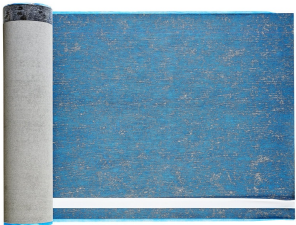
Villasub E-KV-15 SK Schalungsbahn 100 m 2