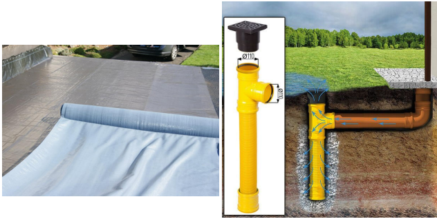
ONDULINE KSK BAHN (Rolle 5m 2 )