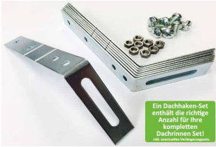
Dachhaken Set für PVC | Satteldach

Ein Dachhaken-Set enthält die richtige Anzahl für Ihre kompletten Dachrinnen-Set!