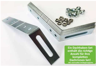
Dachhaken Set für PVC | Satteldach