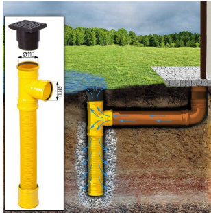
Sickerschacht mit Zufluss/Abfluss Ø 110 mm