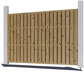
Seitenwand für Carport