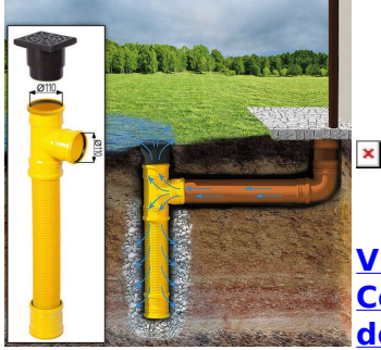
Villas DichtDach Contur 120 m 2 - dolomitgrau

Sickerschacht mit Zufluss/Abfluss Ø 110 mm