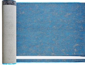
Villasub E-KV-15 SK Schalungsbahn 40 m 2