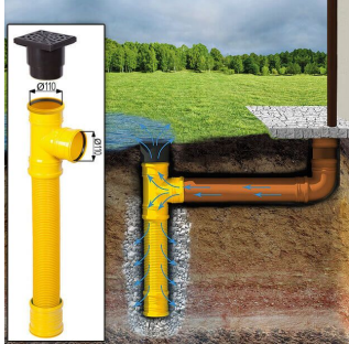
Sickerschacht mit Zufluss/Abfluss Ø 110 mm