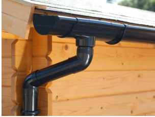
PVC Dachrinnen für Satteldach bis 7 m