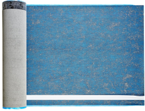
Villasub E-KV-15 SK Schalungsbahn 40 m 2