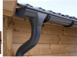
Dachrinnenset Zink für Satteldach bis 6,8 m