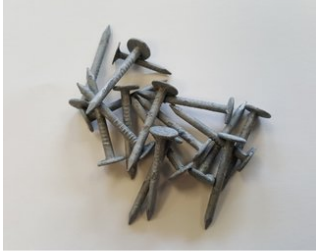
Dachpappennägel (Breitkopfst.) 25/25 verzinkt