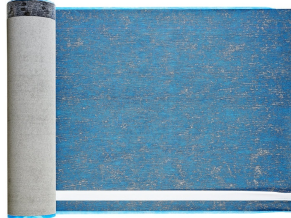
Villasub E-KV-15 SK Schalungsbahn 60 m 2