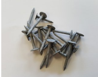
Dachpappennägel (Breitkopfst.) 25/25 verzinkt