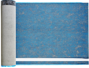
Villasub E-KV-15 SK Schalungsbahn 140 m 2