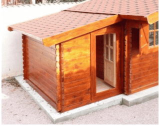
Anbau Werkzeugschuppen - 161 x 273 cm