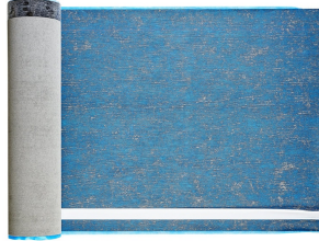
Villasub E-KV-15 SK Schalungsbahn 40 m 2