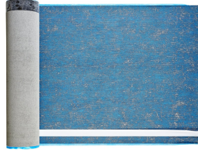
Villasub E-KV-15 SK Schalungsbahn 40 m 2