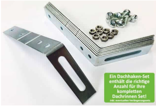
Ein Dachhaken-Set enthält die richtige Anzahl für Ihre kompletten Dachrinnen Set! Mit Gewindestift für Regenrinne.